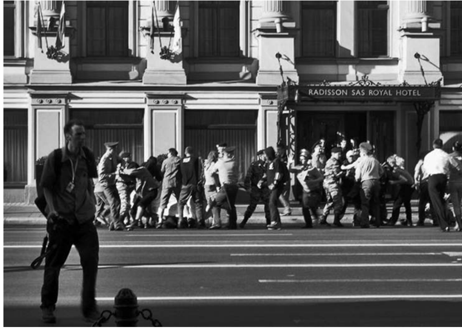
на фото: милиция и ОМОН винтят активистов, перекрывших Невский проспект 16 июля

Кроме того, 11 июля еще в Москве была опробована интересная форма уличных акций. Называлось все это карнавалом против G8. Около сотни человек надели клоунские розовые колпаки, накладные носы, и устроили в центре Москвы пляски и бега. Прохожие вначале офигевали и не могли ничего понять. Потом вся эта толпа стала выкрикивать "Нет Большой Восьмерке" и понеслась по Арбату, стуча в барабаны. За счет ритма народ почти прогнулся в транс и несся единой монолитной колонной, не растягиваясь. Хотя все шествие было несанкционированным, никого не задержали. Менты просто не успели.