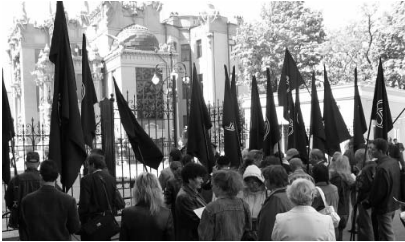
Пикет САУ в Киеве перед администрацией президента

В мае 2005 г. я ездил в Донецк. Больше года с перерывами мы вели переговоры, выясняли позиции. В итоге 1 октября 2006 г. представители РКАС из Донецка и Днепрпетровска посетили Одессу и приняли с Политисполкомом САУ рамочное соглашение о сотрудничестве. Соглашение предварительное и касается пока лишь обмена опытом, информацией, цивилизованной полемики между нашими организациями по вопросам стратегии и тактики анархизма. Предполагается так же и принятие совместных заявлений по вопросам, в которых найдем консенсус,