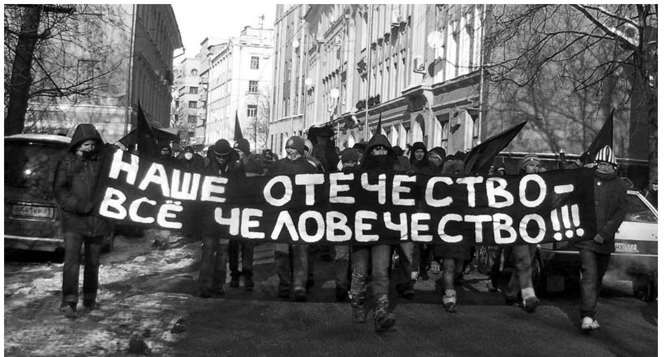
Шествие автономов в Москве 23 февраля в "День Дезертира"

- от кинопоказов в клубах, до нападений на военкоматы. Уже больше десяти лет в России наблюдается стихийное сопротивление призыву. Тысячи молодых людей разными способами косят от армии. Они делают это неосознанно - не из каких-то идеологических побуждений. Просто потому, что государство ограничивает их свободу. Они чувствуют при этом, что государство - чуждое, не народное явление.