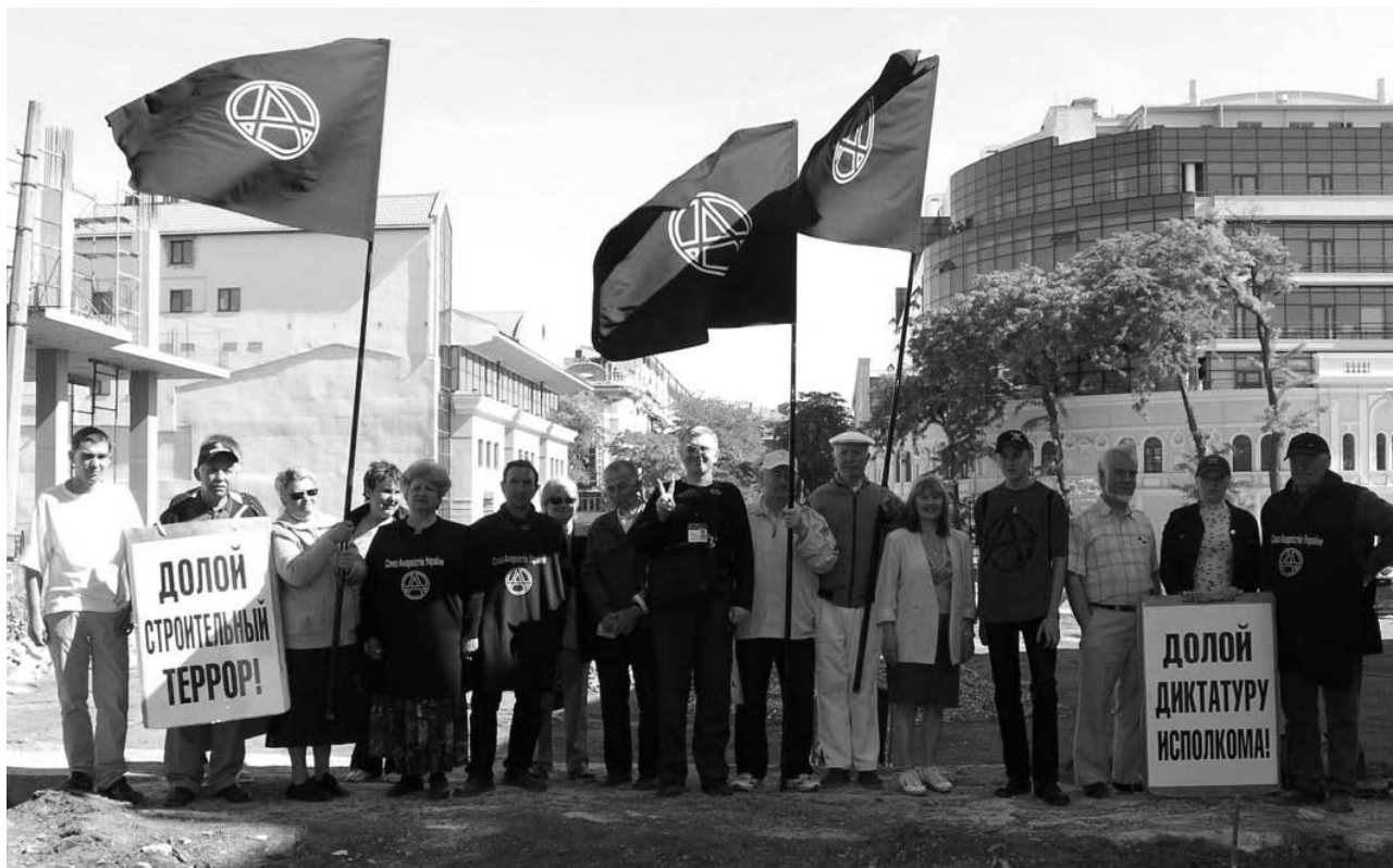
Одна из многочисленных акций САУ в Одессе на Греческой площади против произвола властей

– На вашем сайте я нашел такой призыв: “Наиболее решительные и последовательные активисты из обоих лагерей уже при-