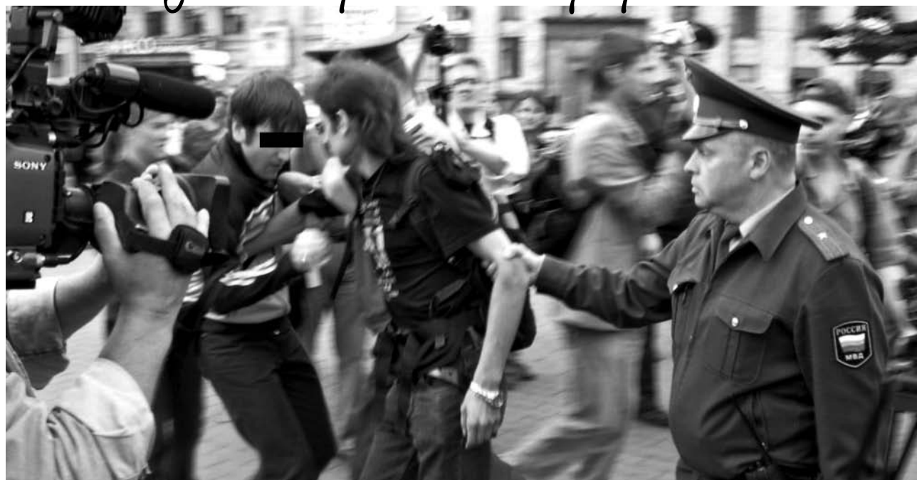
Москва, 3 июля 2007 г. Менты винтят пикет против олимпиады Сочи-2014

Наконец, мы против олимпиад в их современном виде. Мы против профессионального спорта в принципе. Большой спорт служит коммерческим и политическим целям, уродует спортсменов чрезмерными нагрузками и допингом, направляет недовольство масс в сторону от его действительных источников, приучает их к пассивному созерцанию действительности и никак не помогает физическому разви-