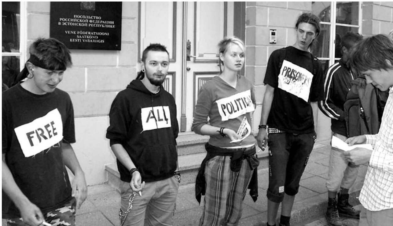
Пикет Puna Must в поддержку политзаключенных у посольства России в Эстонии

щества в Эстонии. Мы говорим о том, что мы думаем как анархисты относительно той или иной проблемы, о том, что мы видим на улицах.